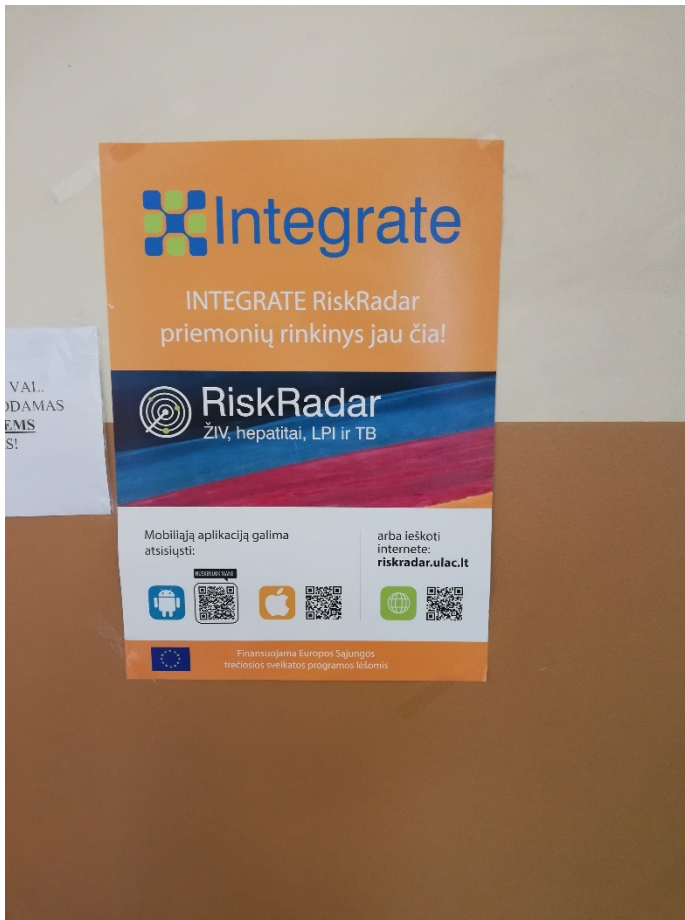
Plakatas Kauno filiale farmakoterapijos metadonu gydymo programoje